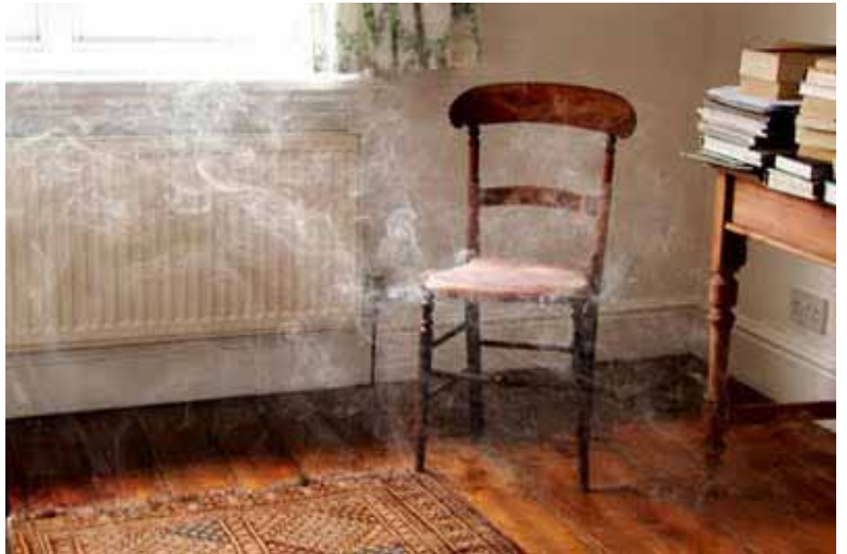
Familiars, Sofia Hultén: la artista invita a su familia a convertir su casa en espacios fantasmales que serán encontrados por otros miembros.

Aproximación gráfica: referentes visuales