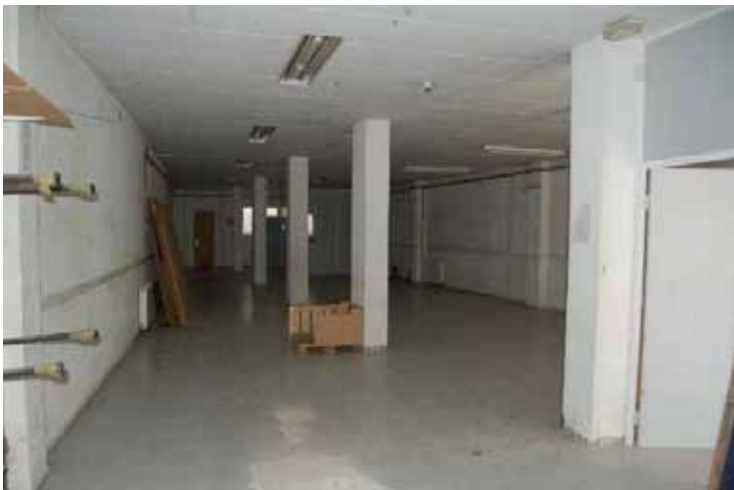
Modelos de espacios donde se desarrollarían las documentaciones.