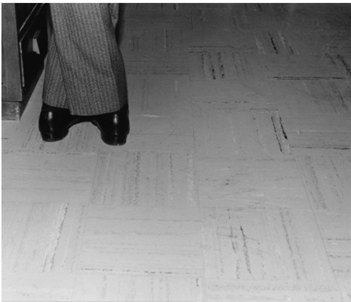
Schweizer Landschaften, Peter Piller: Esta es una selección de imágenes de un archivo de una empresa de seguros que enseñan espacios que han sido escenarios de un incidente.