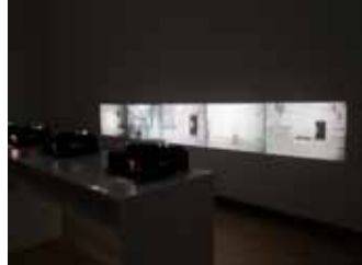
Study for Flipping the White Cube, Mario García Torres: durante la remodelación del Stedelijk Museum el artista convocó a un grupo de personas a desarrollar ciertas acciones en el espacio.